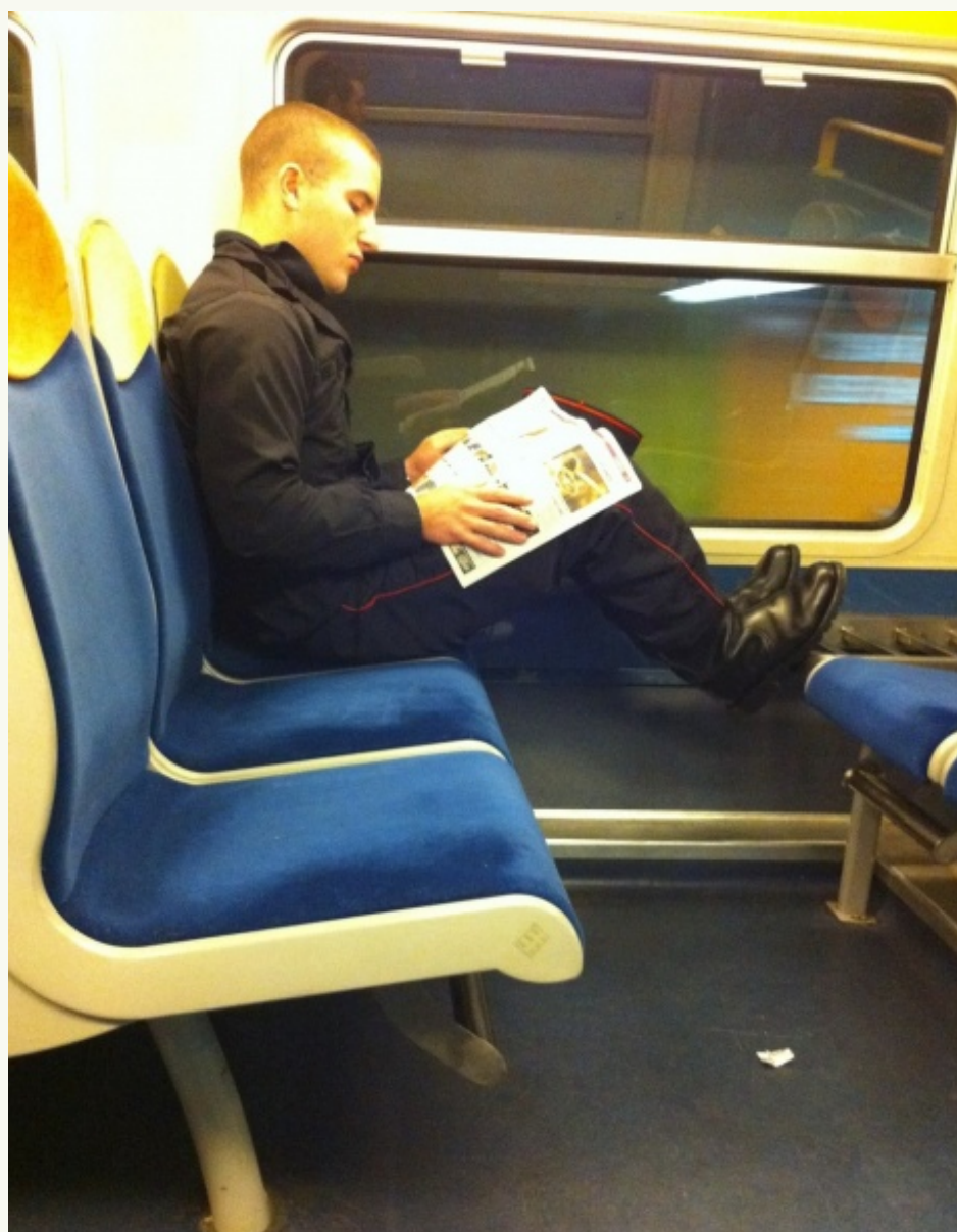
et le fantôme du sapeur pompier RER D - vendredi 15 octobre - 9h20